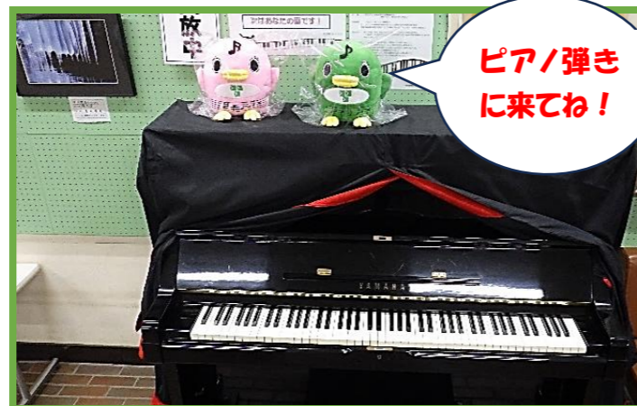
ロビーにピアノ登場！開放時間は、公民館にお問い合わせください。

※事業中止や内容を変更する場合があります。最新情報をホームページ、広報習志野、電話などでご確認ください。 なお、公民館報は、市内各公民館でお渡ししています。