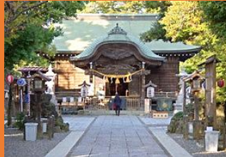
習志野・菊田神社